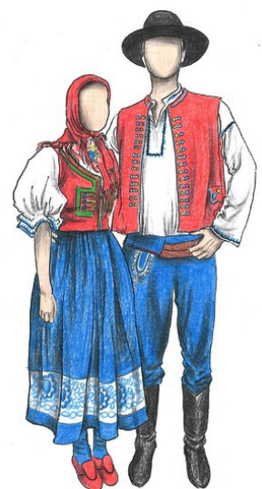
Kroj z Valašska

Lidový kroj se nosí dodnes, ale jen v některých oblastech a při opravdu výjimečných příležitostech. Lidé začali dávat přednost praktičtějšímu a pohodlnějšímu oblečení.