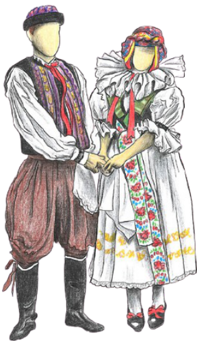
Kroj z Hané

Každá oblast, někdy i vesnice měla svůj vlastní kroj, který se od jiných lišil zdobením, barvou, materiálem, podle toho se dalo poznat, odkud nositel kroje pochází.